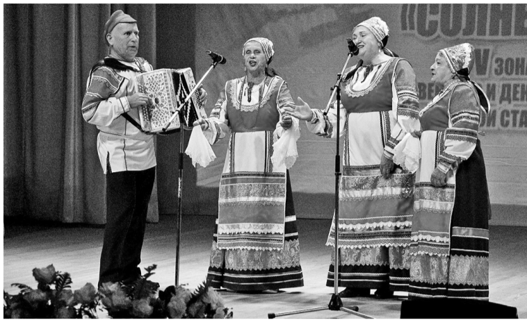
Трио из Советского ГО.