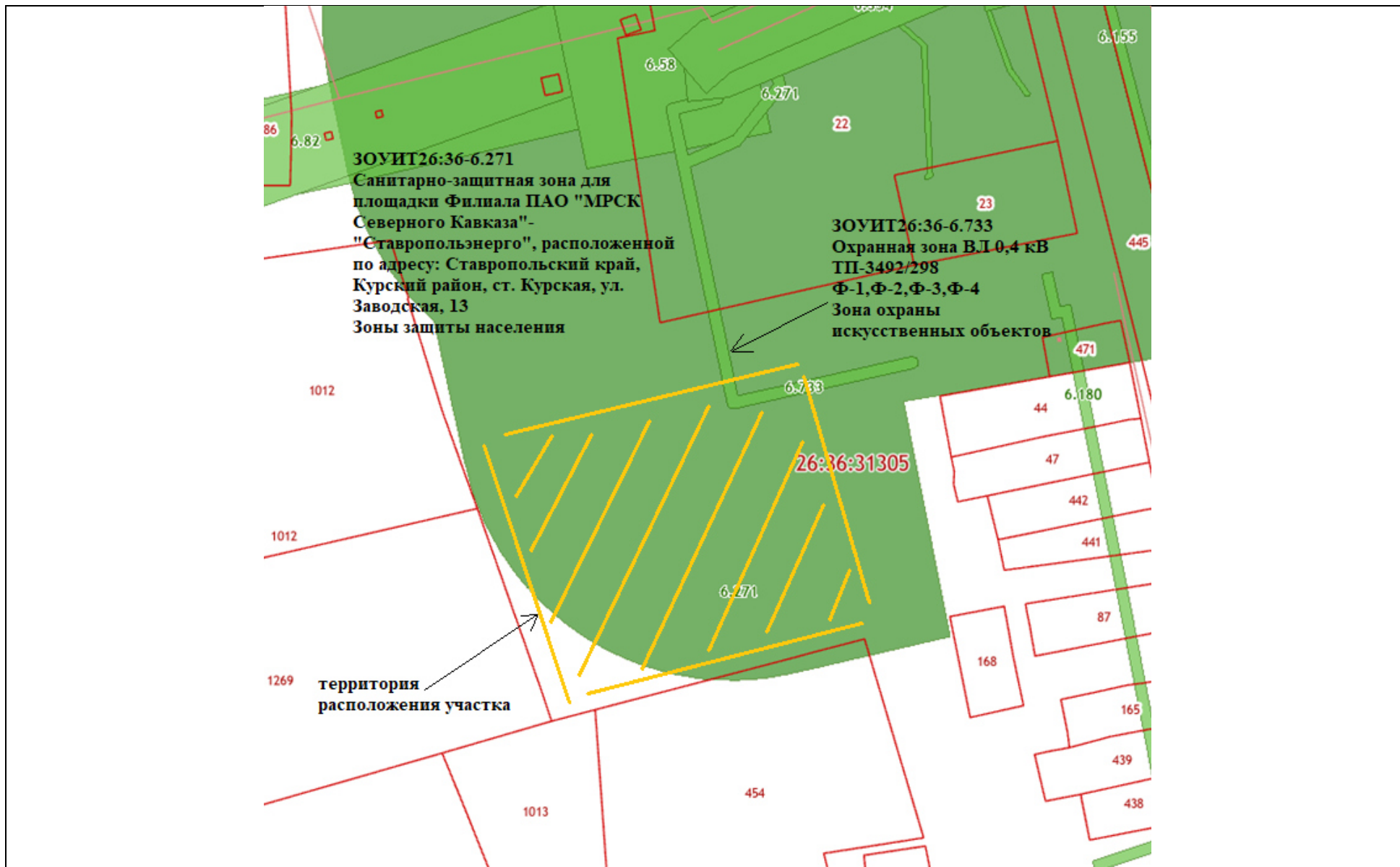
Рис.2 Схема участка в соответствии с публичной кадастровой картой